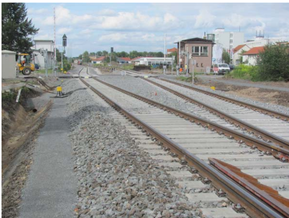
Bf Grimma, BÜ km 19,3 nach Umbau