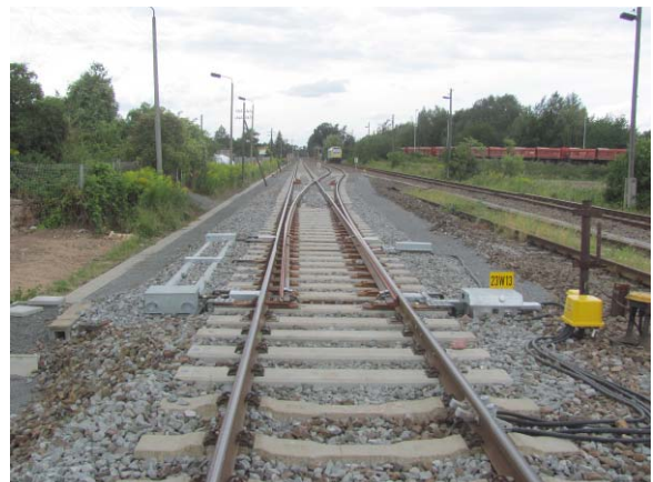
Großsteinberg W13 nach Umbau