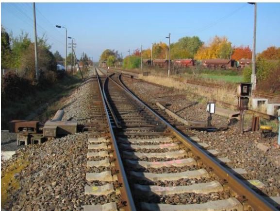
Großsteinberg W13 vor Umbau